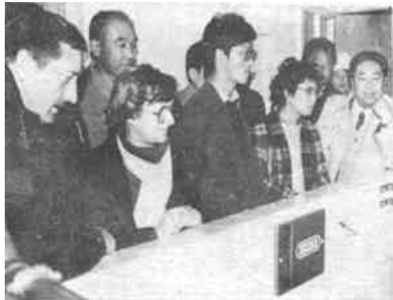
图联邦德国专家检查评估黄河农场奶牛。

算定额耗油，这样算起来年底又可节约资金5万多元。预计到年底可冲减物价上涨成本。(付士杰)